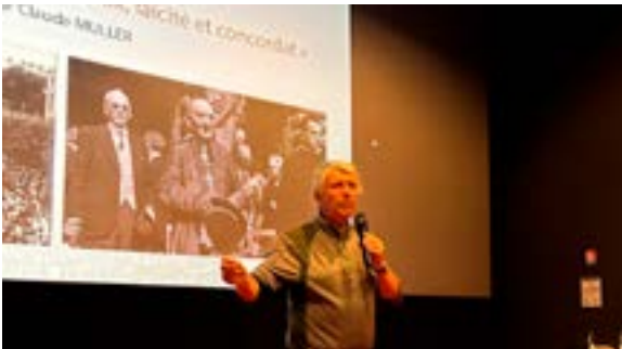
Conférence de la Société d'Histoire (05/06/2026)