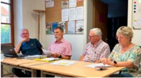
Assemblée Générale Passion Photo Molsheim (02/06/2026)