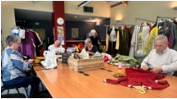
Atelier de réparation de costumes du Comité des Fêtes (09/06/2026)