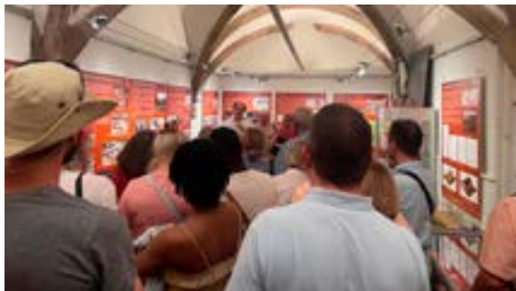
Nuit européenne des musées (23/05/2026)