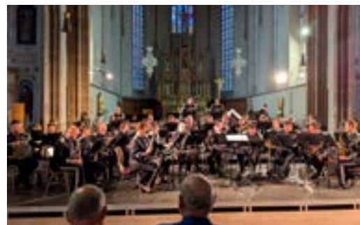
Concert caritatif Chœur d'Hommes 1856 et Musique militaire de l'Arme Blindée Cavalerie dans le cadre du Congrès National des Retraités Militaires (03/06/2026)

Merci de nous faire parvenir des photos de vos manifestations : communication@molsheim.fr