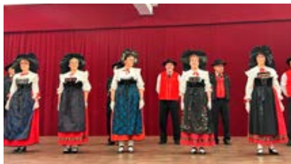
Soirée folklore alsacien (02/06/2026)