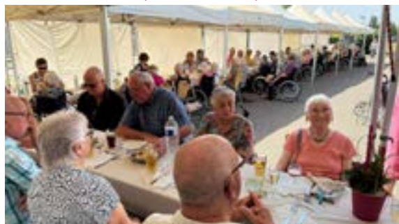
Cochon à la broche à la maison de retraités du Krummbruechel (30/05/2026)