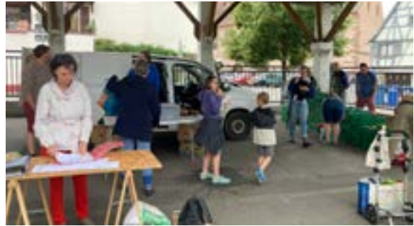
Distribution de l'AMAP de la Bruche (04/06/2026)