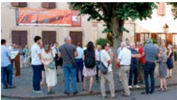
Vernissage de l'exposition 100 000 ans d'histoire au Musée (29/05/2026)