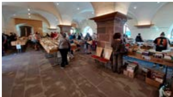
Vente de livres, CD et revues de la médiathèque (23-24/05/2026)