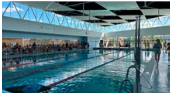
Fête d'été de l'AC2M (07/06/2026)