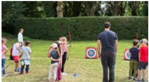
Journée des sports écoles élémentaires (05/06/2026)