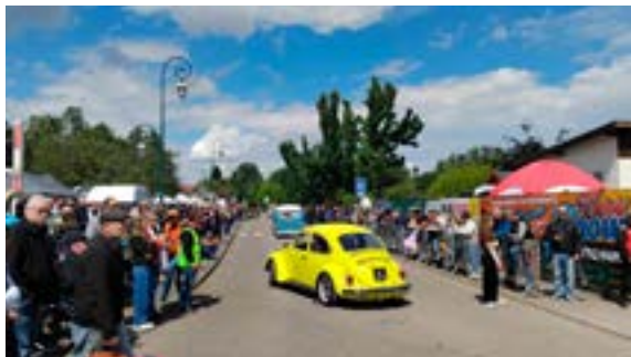
19 e Cox Show (15-17/05/2026)