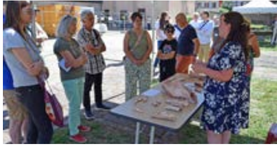
Journée européennes de l'archéologie (14/06/2026)