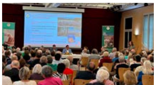
AG régionale des Gîtes de France (08/06/2026)

Merci de nous faire parvenir des photos de vos manifestations : communication@molsheim.fr