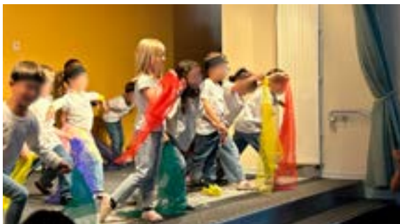
Fête de l'école des Prés (05/06/2026)