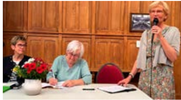
Assemblée Générale des Amis de la chapelle Notre-Dame (02/06/2026)