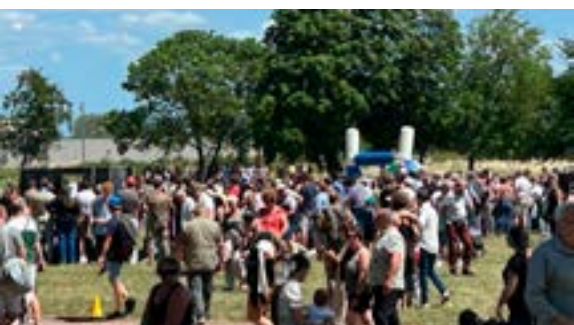
Portes ouvertes du 44e Régiment de Transmissions (07/06/2026)