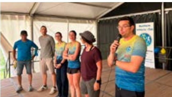
10 ans du Molsheim Athletic Club (MAC) (06/06/2026)