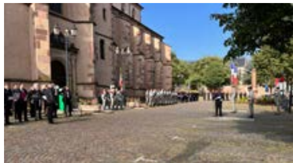
Cérémonie commémorative (08/05/2026)