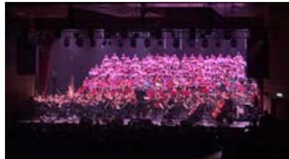
Les Musiciens du Choeur au Dôme (15-17/05/2026)

Merci de nous faire parvenir des photos de vos manifestations : communication@molsheim.fr