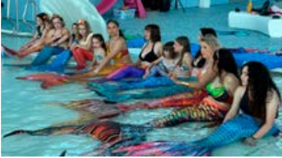
Découverte du Siren'Art (26/04/2026)