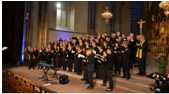
Concert requiem de Fauré (02/05/2026)