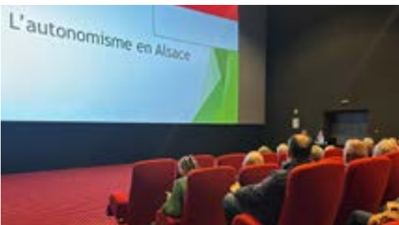
Conférence de la Société d'Histoire et d'Archéologie (24/04/2026)