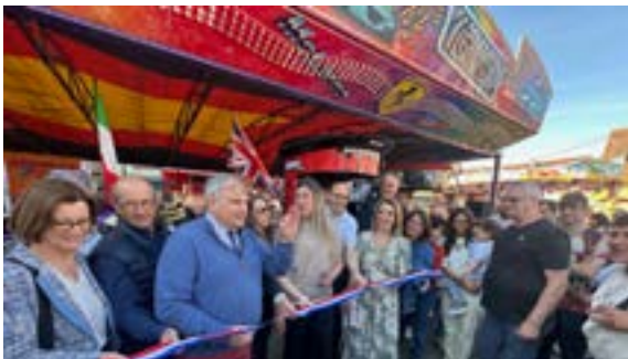
Inauguration de la foire (24/04/2026)