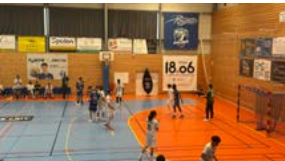
Match de handball MOC/ Tremblay (25/04/2026)