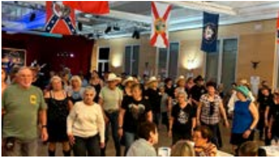
Soirée country Molsè'Country Dancers (18/04/2026)