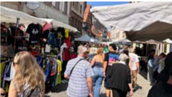
Marché aux puces du Lions Club (08/05/2026)