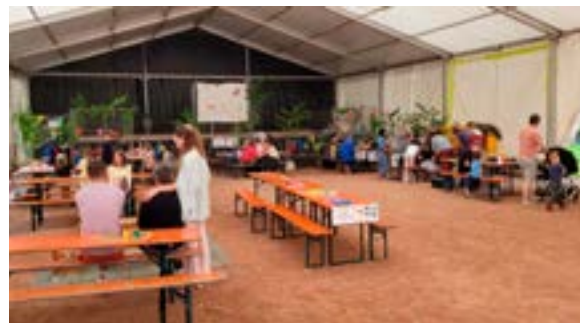
La nature en fête (10/05/2026)