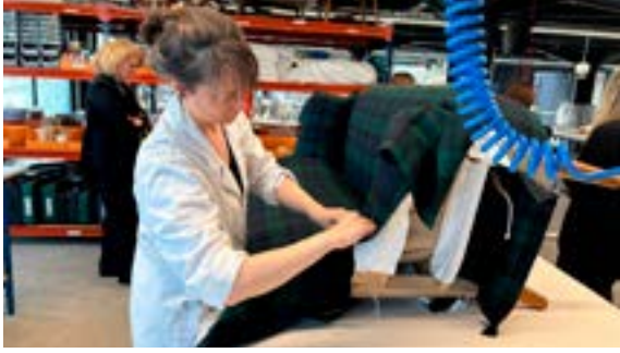
Portes ouvertes et ateliers chez Norki (11-12/04/2026)