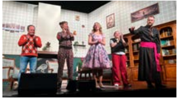
Théâtre les Mod'Est au Dôme (18/04/2026)