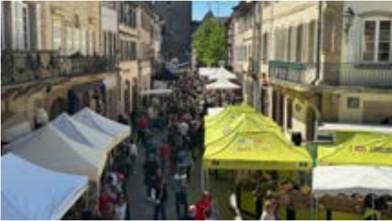
Braderie annuelle (01/05/2026)