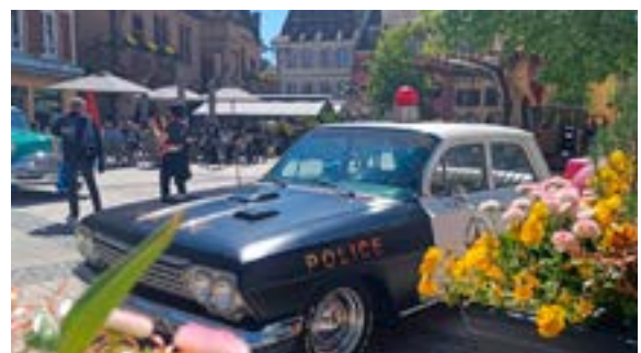
La rue de Stras en fête (25/04/2026)