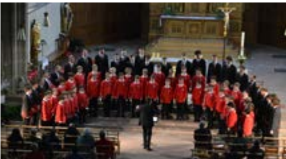
Concert cantate Domino (15/05/2026)