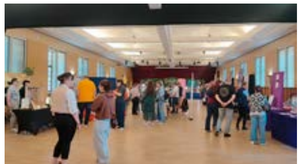
Salon Medi'Zen (25-26/04/2026)