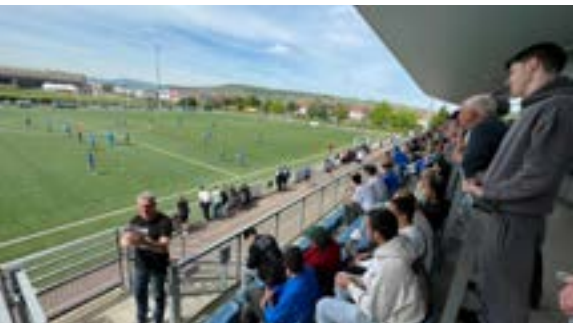
Match de football féminin D3 (03/05/2026)