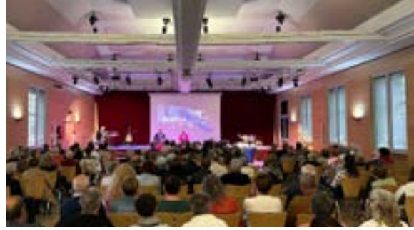
Remise des prix du fleurissement et des lumières de Noël (28/04/2026)