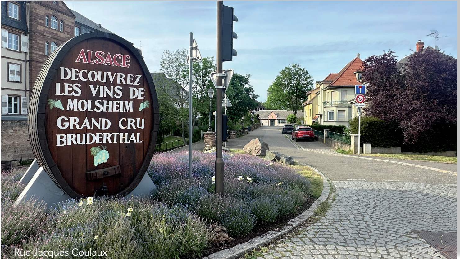
Rue Jacques Coulaux

Dans le cadre de ses missions, Barr énergies (anciennement Gaz de Barr) entreprend différents travaux d'entretien du réseau gaz de ville entre le secteur de la rue Jacques Coulaux jusqu'à la rue Notre-Dame en passant par la rue de la Monnaie et la rue du Mal Kellermann . Ces interventions sont obligatoires et contraintes par la réglementation.