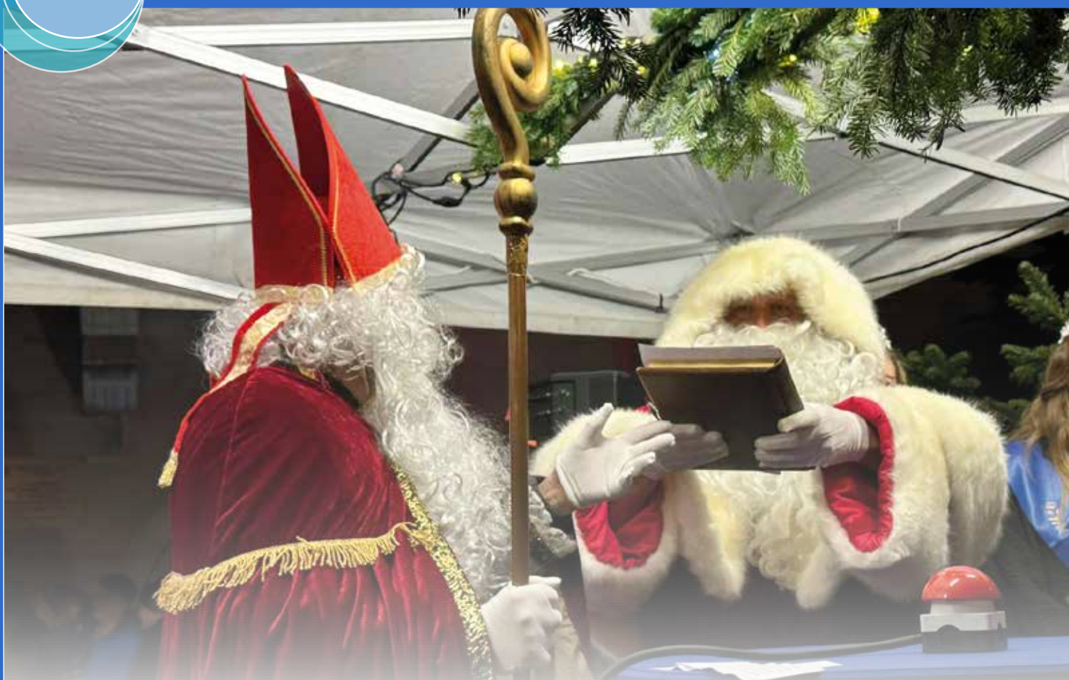
Lors du lancement des illuminations, saint Nicolas a remis le grand livre qui recense les noms de tous les enfants sages au Père Noël, avant d'appuyer sur le bouton magique déclenchant les lumières du sapin et toutes les illuminations de la Ville.