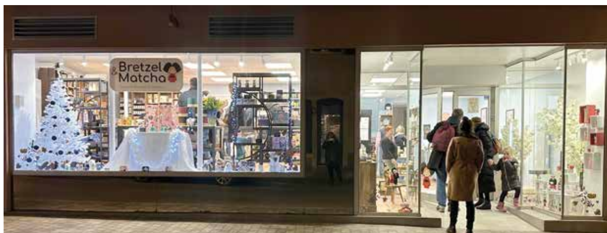
Bretzel & Matcha a ouvert ses portes fin novembre au 19 rue de Saverne.

Tél. 06 87 50 35 72 ou 06 87 50 75 10 - www.bretzeletmatcha.fr