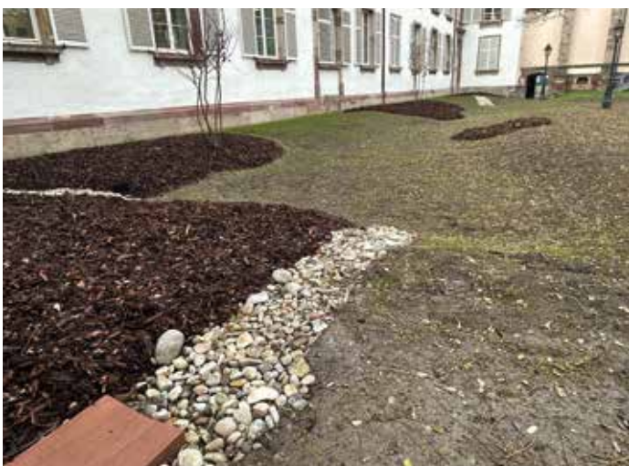
Une pente douce a été créée le long du lycée Camille Schneider au parking Kellermann pour assurer l'infiltration des eaux de pluie. Des copeaux ont été répandus pour couvrir les gaines géotextiles. Enfin quelques plantations ont été effectuées.