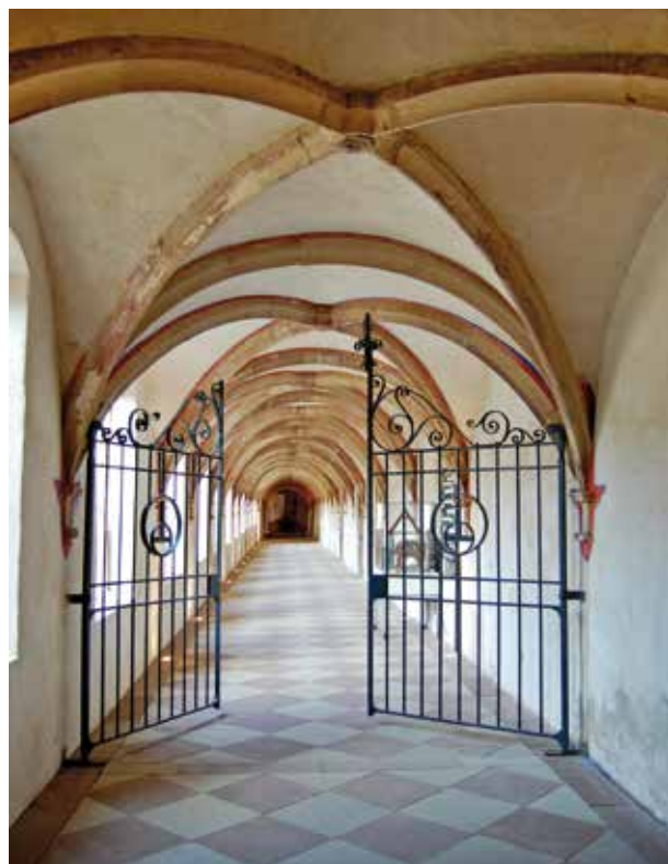
Vue intérieure du grand cloître. Musée de la Chartreuse, Molsheim.

"Nous partîmes par la rue de l'Église sur la place de l'Hôtel-de-Ville. La Metzиг éveilla naturellement sa curiosité, mais sans qu'il y insistât. Il s'arrêta plus longtemps devant la fontaine aux sept bouches [...], médita devant cette eau qui descend, monte, pensa-t-il, et redescend dans un éternel retour. Nous allions vers la Chartreuse pour nous faire visiter par mes amis l'intérieur et le jardin, c'est-à-dire l'endroit où Goethe avait encore vu la chapelle avec les fameux vitraux. Rilke se fit raconter la visite de Goethe à la Chartreuse. C'est là, dis-je à Rilke, que selon toute probabilité, Goethe a pris le modèle de son "Ritter Georg" dans son Goetz."