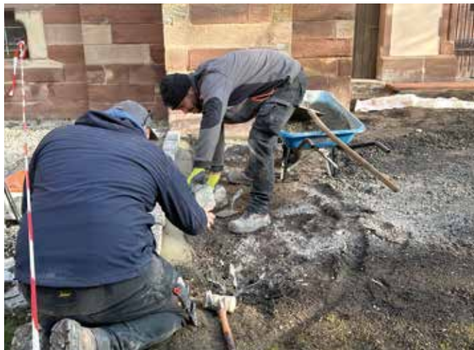
Après les terrassements, les ouvriers ont dû procéder à quelques travaux de pose de bordures pour bien délimiter l'espace.