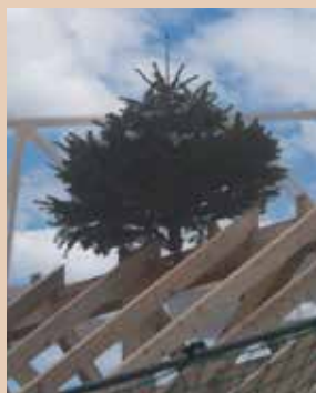
Un sapin trône sur la charpente.

La pose de la première pierre de la Résidence seniors s'est déroulée le jeudi 20 mars. Mi-décembre, les entreprises et la maîtrise d'œuvre ont installé un sapin décoré de rubans. Cette coutume dénommée Richtfest marque la fin du gros œuvre, de la charpente et de la maçonnerie du premier bâtiment. Comprenant 56 logements de type deux pièces (T2) et trois pièces (T3), dont 34 conventionnés et 22 en location libre, le programme devrait être livré à la fin du deuxième semestre 2026.