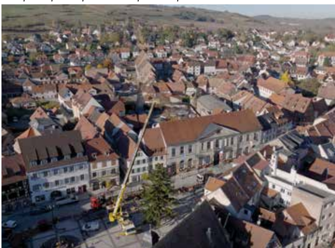
Après le grutage et le transport, l'épicéa arrive en fin de matinée sur la place de l'Hôtel de Ville, escorté par la Police municipale. Il s'agit ensuite de bien l'installer.