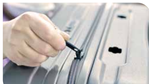
Conception de la Dot-Drops, le produit phare de Jump.