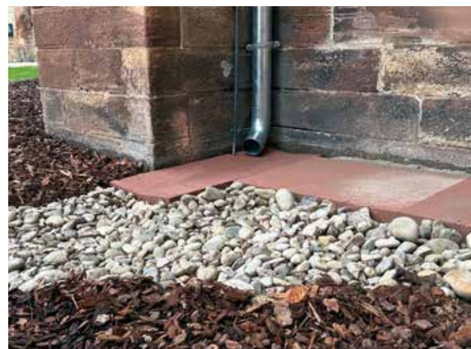
Les gouttières ont été déconnectées du réseau nominal d'assainissement. La pluie est dirigée via une dalle en grès vers le jardin de pluie.