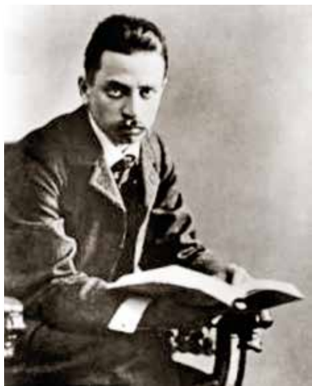
Le poète Rainer Maria Rilke, vers 1900.

"Cette visite l'a fortement impressionné à son tour. Nous sommes sortis [...] de la ville pour longer l'extérieur du mur d'enceinte. C'est là que Rilke me dit : "Cela me rappelle un peu certains coins de ma ville natale" (Prague). À la Poudrière, nous nous sommes arrêtés. Il tourna ostensiblement le dos à la Sous-Préfecture dont le style semble lui déplaire. Car, de toute évidence, il avait l'intention de demeurer, en