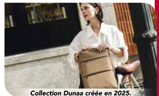
Collection Dunaa créée en 2025.