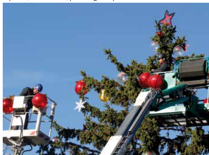
Les lutins électriciens ont déployé près de 1 600 mètres de guirlandes lumineuses autour du tronc et des branches du sapin et ont dissimulé un couple de cigognes, niché quelque part sur la place...