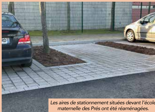
Les aires de stationnement situées devant l'école maternelle des Prés ont été réaménagées.