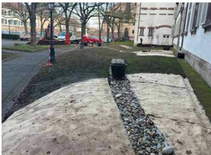
La fibre géotextile déployée sur les espaces verts limite la prolifération des mauvaises herbes tout en permettant à l'eau de s'infiltrer naturellement.