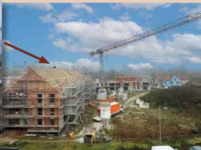
La charpente du premier bâtiment a été installée début décembre.