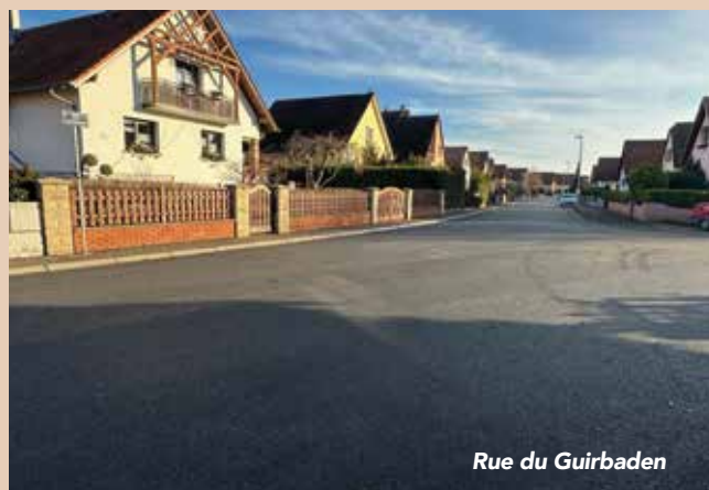
Rue du Guirbaden