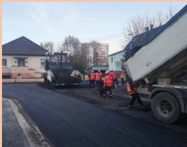
Les enrobés ont été tirés dès début décembre.

Les enrobés ont été posés sur l'ensemble de l'emprise. Certains mâts d'éclairage souffrant de corrosion ont également été remplacés. L'entreprise Eurovia reviendra courant janvier pour effectuer des travaux de finition comme certains joints de