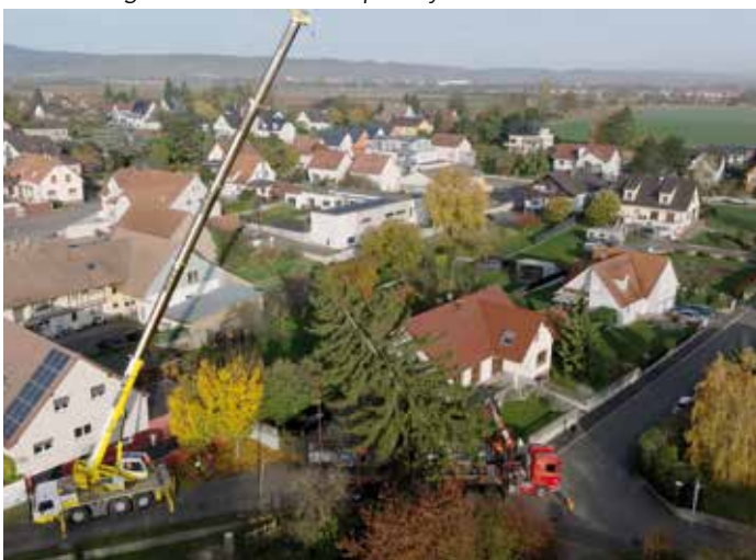
Malgré un accès difficile l'opération de grutage s'est bien déroulée grâce au professionnalisme des agents présents. Une fois coupé, l'épicéa pesait près de cinq tonnes pour une hauteur de 18 mètres.