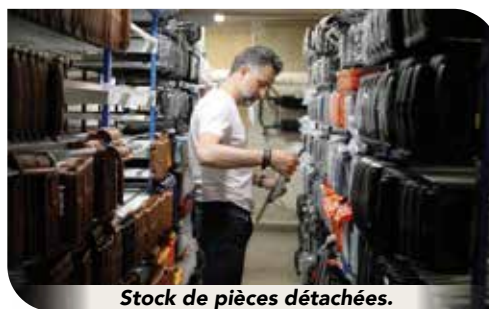
Stock de pièces détachées.