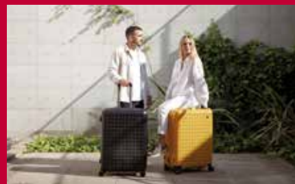
Les bagages Dot-Drops restent la marque signature de l'entreprise.

Jump 18 route de Dachstein https://jump.fr Email : commande@jump.fr tél. 03 88 38 16 44 Horaires - accueil téléphonique Du lundi au jeudi de 14 h à 17 h le vendredi de 9 h à 12 h