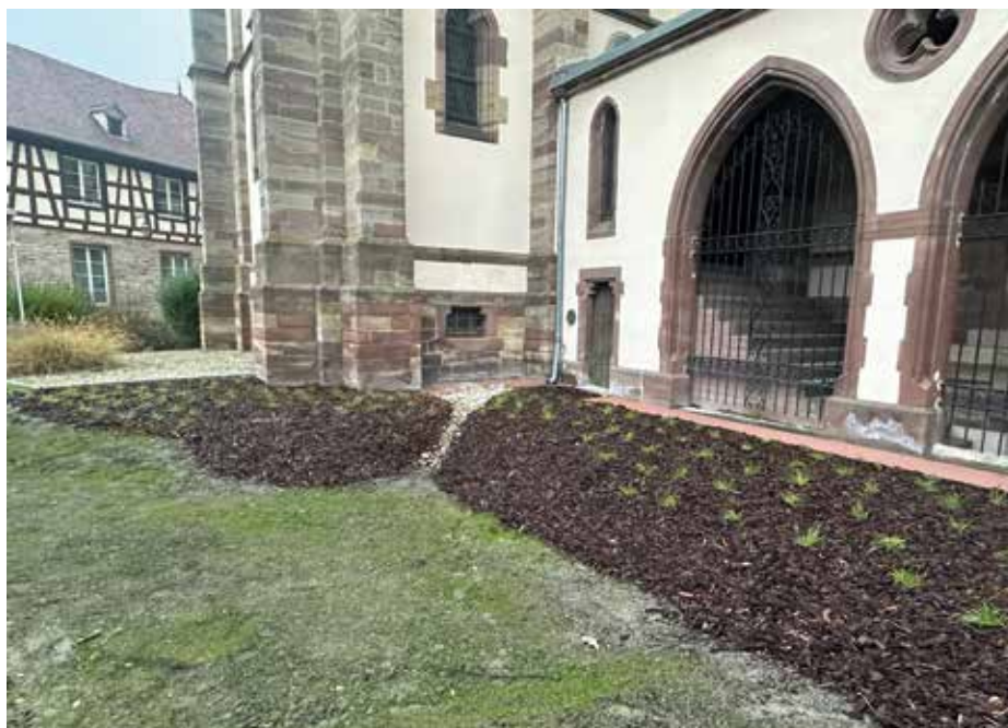
Au total ce sont près de 500 mètres carrés de toitures qui ont été déconnectés pour ce projet de deux jardins de pluie allée de la Petite Sorbonne et au parking Kellermann.

Pour poursuivre sa politique de déconnexion des eaux pluviales des réseaux unitaires, la Ville vient d'aménager deux jardins de pluie, allée de la Petite Sorbonne et au niveau du parking Kellermann, le long du lycée Camille Schneider. Ce chantier a été effectué à Molsheim par la Communauté de communes de la région de Molsheim-Mutzig.