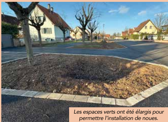
Les espaces verts ont été élargis pour permettre l'installation de noues.

Des aires de stationnement en pavés drainants ont également été aménagées, toujours pour faciliter l'infiltration des eaux de pluie dans la nappe phréatique. Enfin, les revêtements (enrobés chaussées et trottoirs) ont été renouvelés.