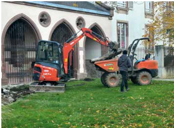
Les travaux ont démarré fin octobre et ont été assurés par l'entreprise Merlet Paysage de Barembach.