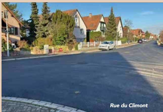
Rue du Climont