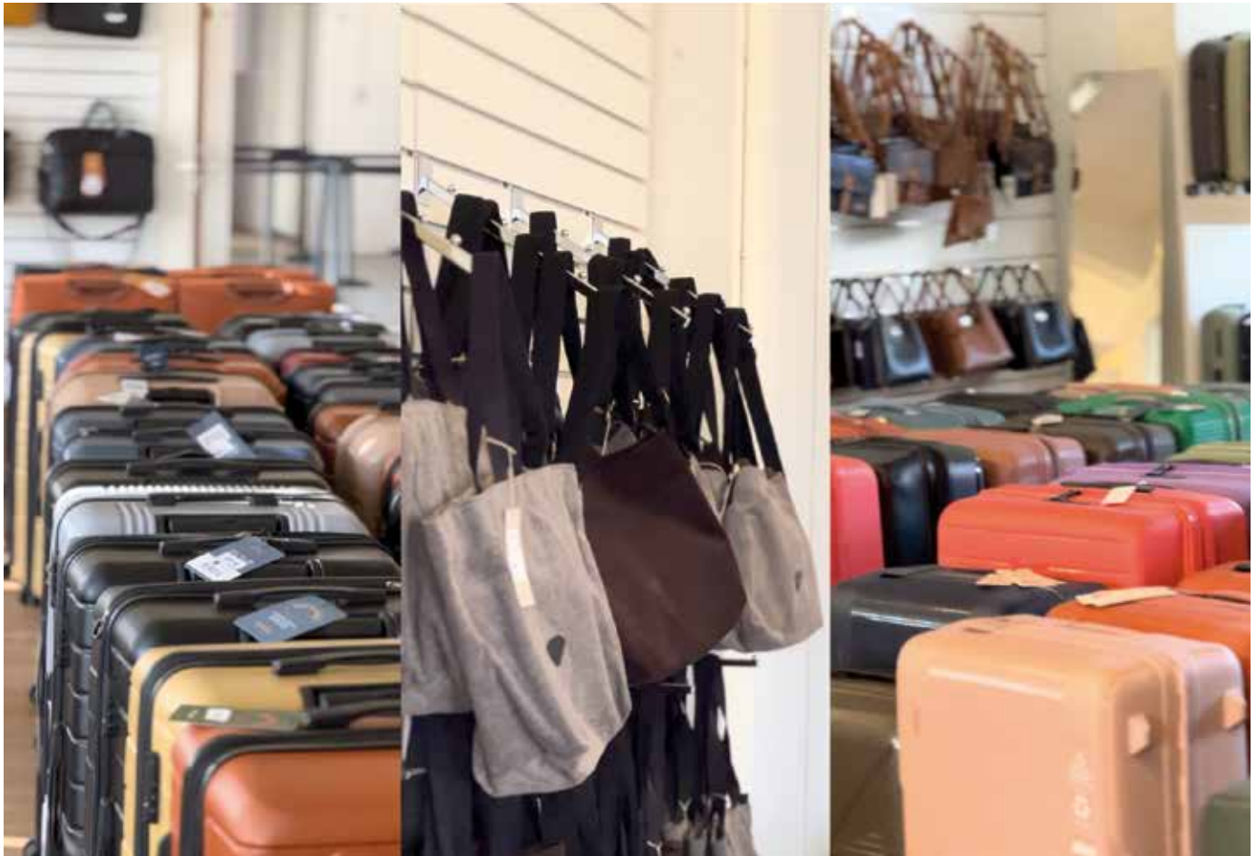
Les ventes au déballage de Jump attirent un public nombreux venu notamment des quatre coins de la Région. Trois rendez-vous annuels sont programmés, au printemps, en été et avant les fêtes de fin d'année. La dernière opération s'est déroulée fin novembre.