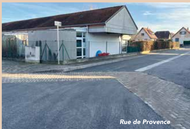
Rue de Provence

La Ville a entrepris la rénovation des revêtements de sept voiries au quartier des Prés du 27 novembre au 12 décembre. Après avoir raboté et nivelé la chaussée, l'agence Colas basée à Erstein a tiré les enrobés le samedi 6 pour les rues d'Anjou, de Provence et de Savoie, puis les 11 et 12 décembre pour les rues du Béarn, du Climont, du Guirbaden et du Nideck. En raison de la fermeture des centrales d'enrobés, les revêtements des trottoirs et des sentiers piétonniers ne seront traités que courant février 2026, au moment de leur réouverture.