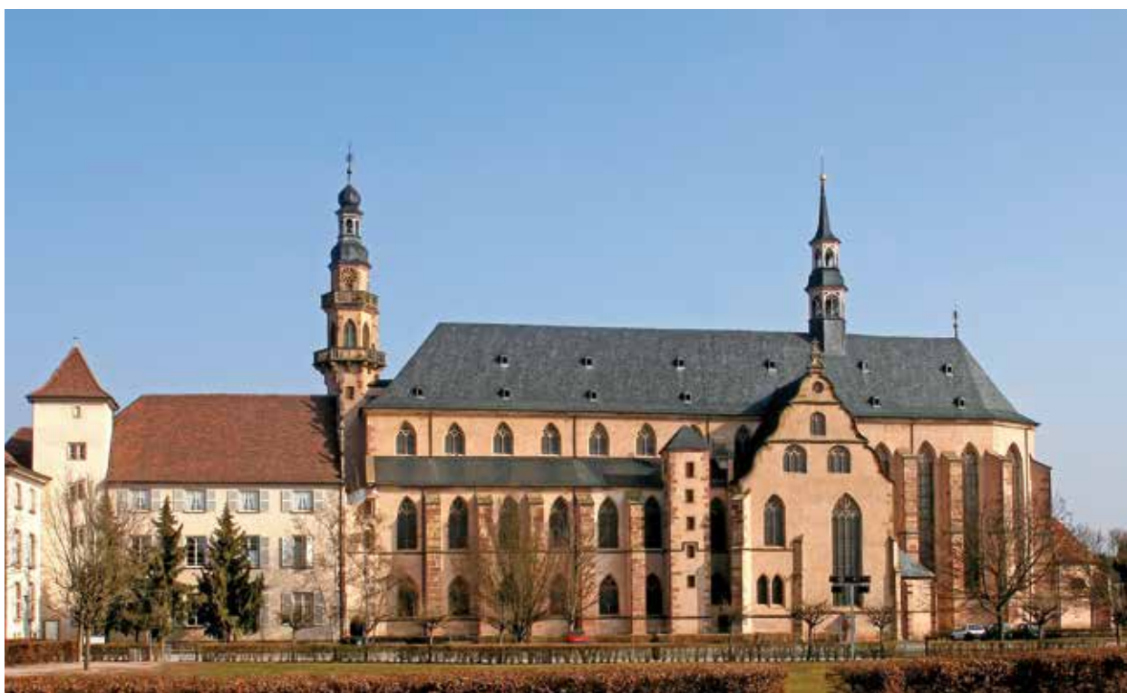
Face Sud de l'église des Jésuites.