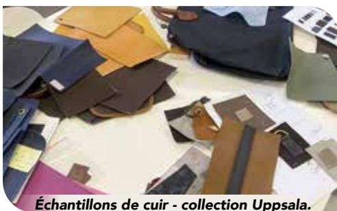
Échantillons de cuir - collection Uppsala.