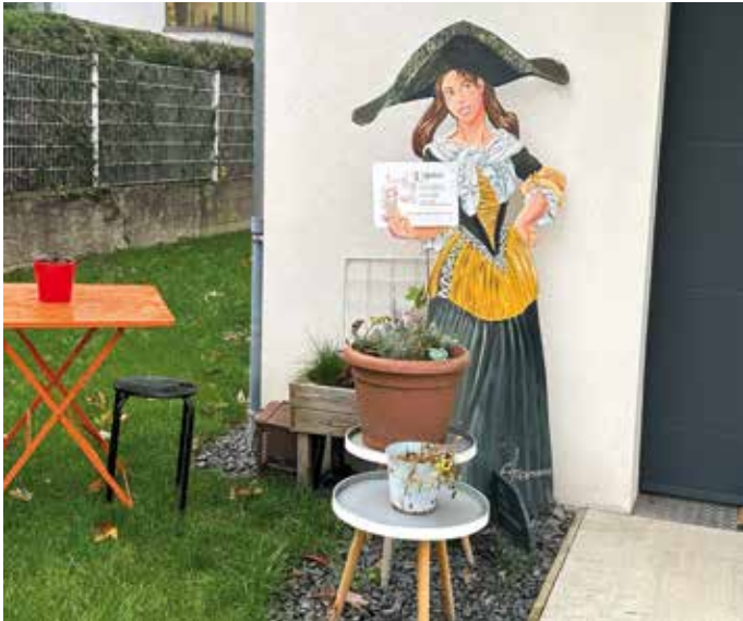
L'Atelier est situé au 15 A rue du Faisan. C'est Aline en personne qui accueille les visiteurs.