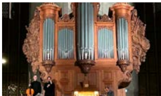
Concert orgue et violoncelle (11/01/2026)