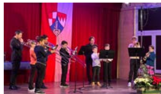
Cérémonie des vœux (07/01/2026)