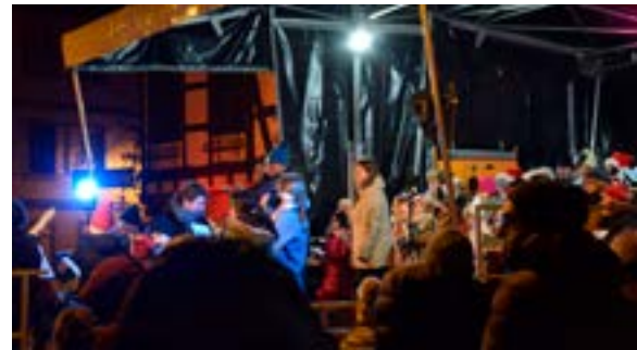
Chantons Noël sous le sapin (24/12/2025)