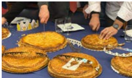
Remise de la galette des rois par la corporation des boulangers du Bas-Rhin (13/01/2026)

Merci de nous faire parvenir des photos de vos manifestations : communication@molsheim.fr