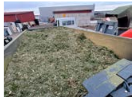
Ramassage et broyage des sapins de Noël (07/01/2026)