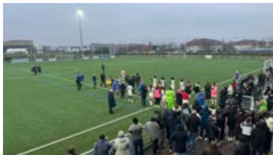
16 e de finale de la coupe de France féminine D3 (11/01/2026)