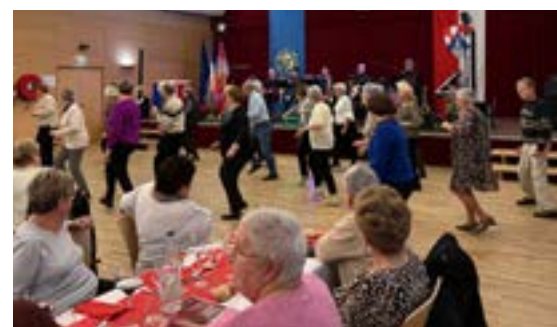
Repas des aînés du CCAS (10/01/2026)