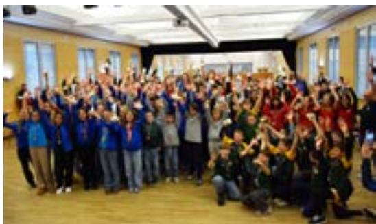
Remise des trophées des sports (11/01/2026)