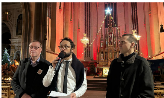
Concert orgue et violoncelle (11/01/2026)