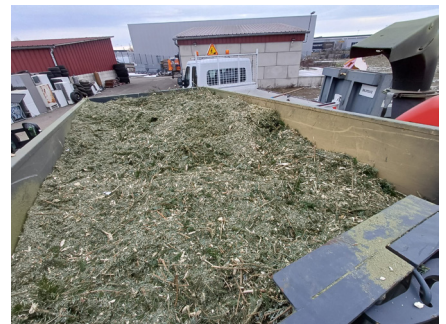
Ramassage et broyage des sapins de Noël (07/01/2026)