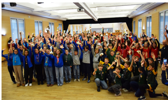
Remise des trophées des sports (11/01/2026)