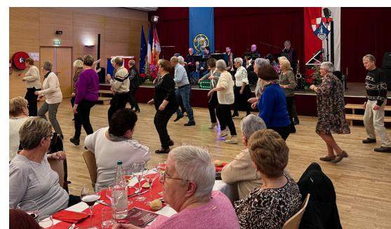
Repas des aînés du CCAS (10/01/2026)