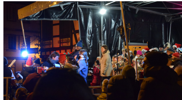
Chantons Noël sous le sapin (24/12/2025)