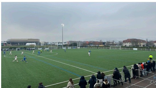
16 e de finale de la coupe de France féminine D3 (11/01/2026)