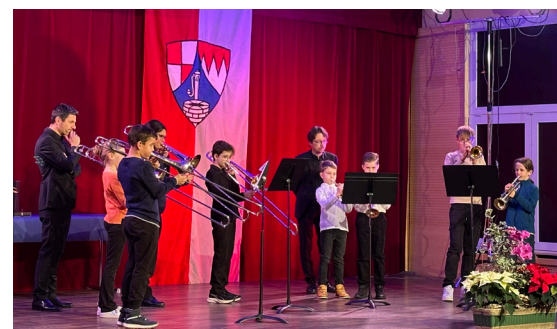
Cérémonie des vœux (07/01/2026)