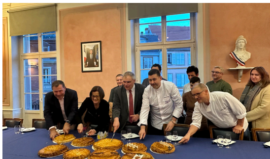
Remise de la galette des rois par la corporation des boulangers du Bas-Rhin (13/01/2026)