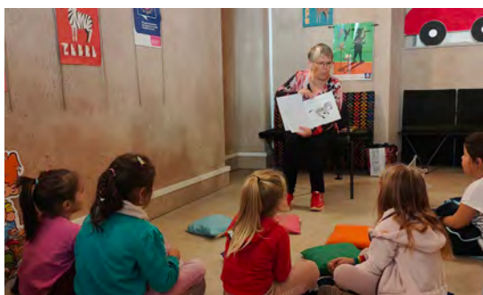
Animation à la médiathèque