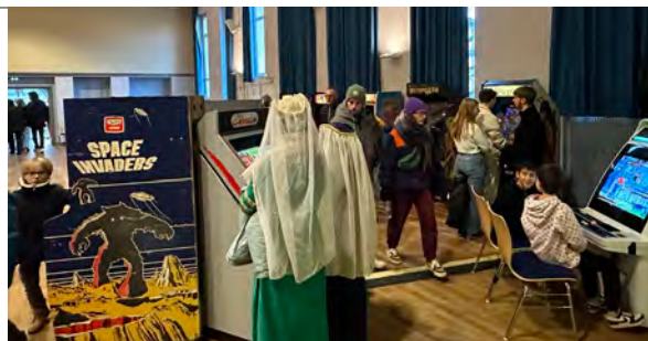
Animation bornes d'arcades à l'Espace St Joseph