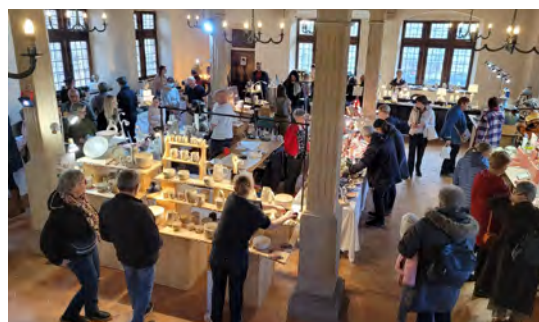
4 e Rencontre de potiers & céramistes (15-16/11/2025)