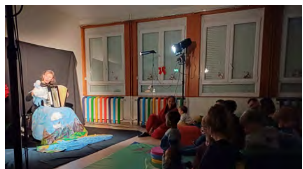
Fête de la crèche familiale Bugap'tits (16/12/2025)