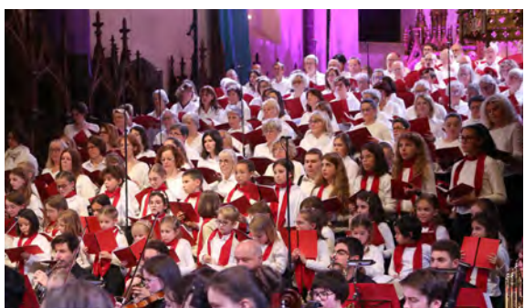
Concert des Musiciens du Choeur au Dôme (21-23/11/2025)