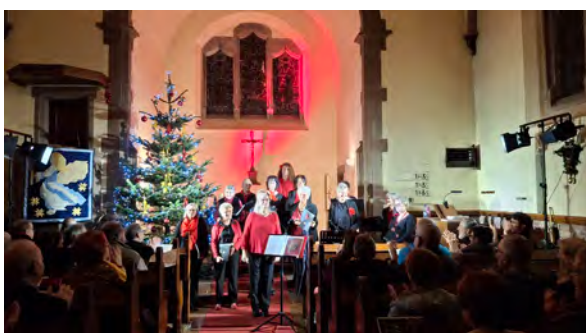
Concert du Coeur de femmes de Molsheim (13/12/2025)