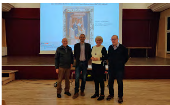
Conférence du Jardin des Sciences (11/12/2025)