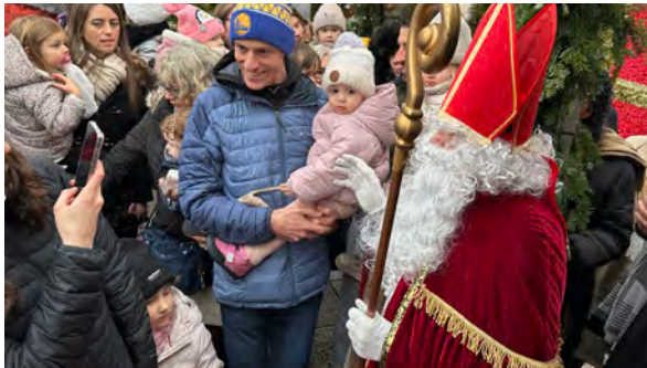
Arrivée de St Nicolas (7/12/2025)