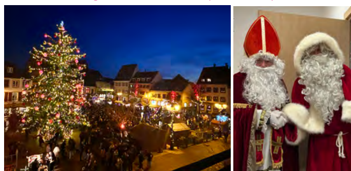
Lancement des illuminations de Noël (29/11/2025)