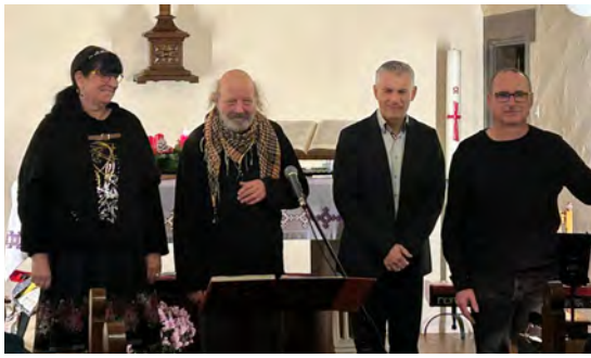
Veillée de Noël en alsacien (29/11/2025)