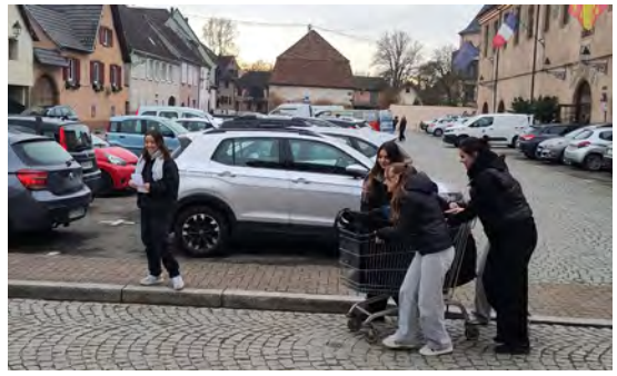
Distribution des colis du CCAS aux personnes âgées (3/12/2025)