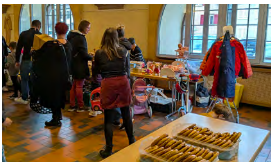
Bourse puériculture de l'association Eltern (15/11/2025)