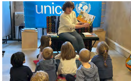
Histoires pour les 3-7 ans sous le signe des droits des enfants à la médiathèque (19/11/2025)