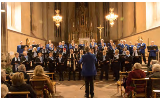
Concert du Choeur d'Hommes 1856 (7/12/2025)