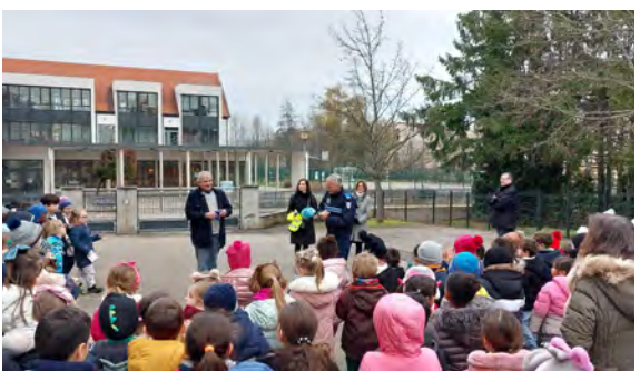
Remise des équipements de sécurité vélo pour les classes de CP (28/11/2025)