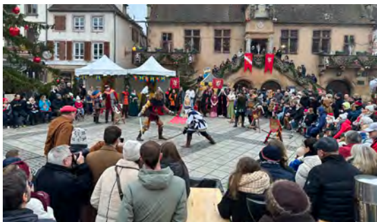
Noël d'antan (14/12/2025)