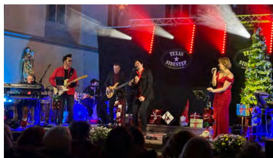
Concert de Noël de Texas Sidestep (23/11/2025)