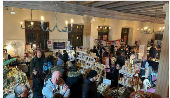
Marché de Noël