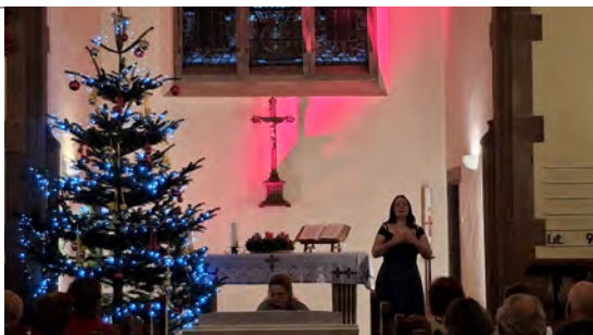
Concert à l'église protestante (14/12/2025)