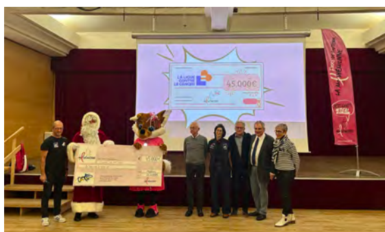
Remise du chèque de La Molshémienne à la Ligue contre le cancer (26/11/2025)