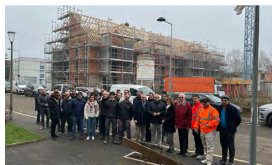
Fête du sapin, résidence sénior (12/12/2025)