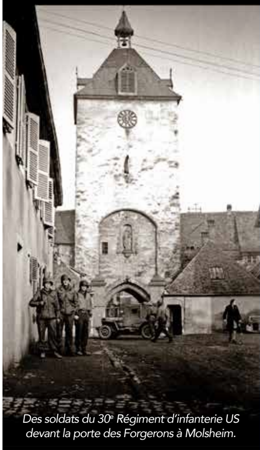
Des soldats du 30 e Régiment d'infanterie US devant la porte des Forgerons à Molsheim.