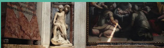
Intérieur de la chapelle Chigi

CYCLE DE 7 CONFÉRENCES ARTS ET SPIRITUALITÉ AU CAVEAU DE LA CHARTREUSE DE MOLSHEIM LE SAMEDI DE 16H30 À 18H