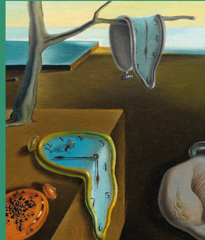
Détail gauche de "La persistance de la mémoire ou les montres molles" de Dalí @ New-York, Museum of Modern Art, 1931