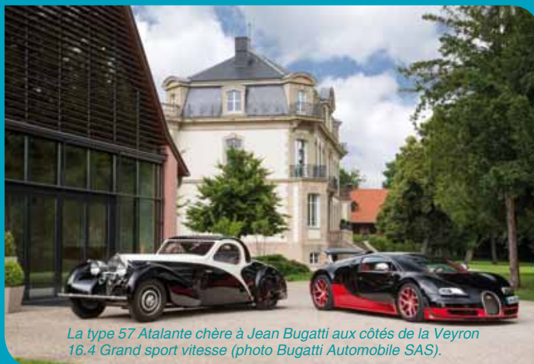
La type 57 Atalante chère à Jean Bugatti aux côtés de la Veyron 16.4 Grand sport vitesse.

la quatrième édition des Légendes Bugatti, dont le nom est encore gardé secret.