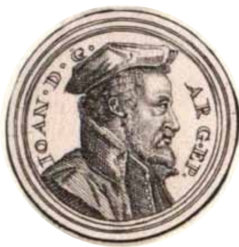
Jean IV, comte de Manderscheid-Blankenheim, d'après une miniature de l'époque.

Jusqu'alors doyen du Grand-Chapitre, Jean de Manderscheid apparut comme le seul candidat recevable au siège épiscopal de Strasbourg, à cause de ses origines mi-catholiques et mi-protestantes. Après de longues tractations et les recommandations du sénat strasbourgeois, il sortit de l'urne comme « évêque élu », le 26 janvier 1569. Son élection fut proclamée à la cathédrale du haut du jubé et, selon la tradition, on le fit asseoir sur le maître-autel.