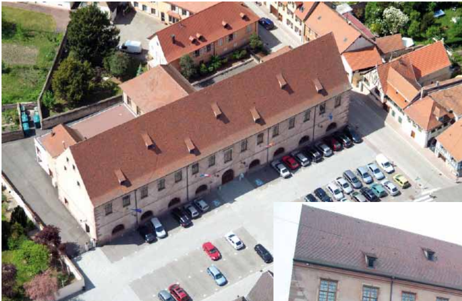
L'actuel « Hôtel de la Monnaie » fut construit en 1722, à l'emplacement de l'atelier monétaire fondé en 1573 par Jean de Manderscheid.