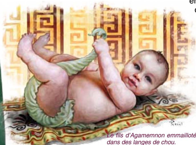
Le fils d'Agamemnon emmailloté dans des langes de chou.