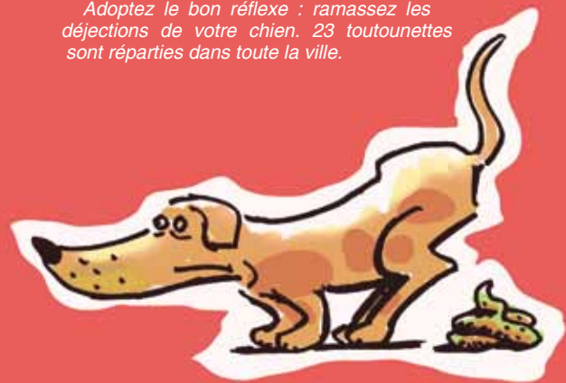
Dessin : Jean-Pierre Autheman

Adoptez le bon réflexe : ramassez les déjections de votre chien. 23 toutounettes sont réparties dans toute la ville.