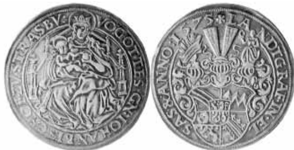
Avers et revers d'un « Thaler » (monnaie en argent valant 60 Kreuzer), frappé en 1575 dans l'atelier épiscopal de Molsheim.