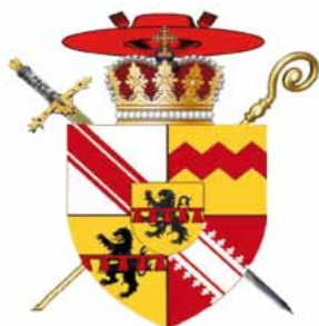
Blason de Jean de Manderscheid, combinant ses armoiries familiales, celles de l'évêché de Strasbourg et celles du landgraviat de Basse-Alsace.

Alors que les guerres de religion sévissaient en France, les tentatives de l'évêque Jean en faveur de la paix restèrent vaines en Alsace, ce qui ne l'empêcha pas de consolider de nombreuses fortifications épiscopales. Ainsi, en 1583, il entreprit la restauration du château du Haut-Barr (près de Saverne) « pour la protection de ses sujets