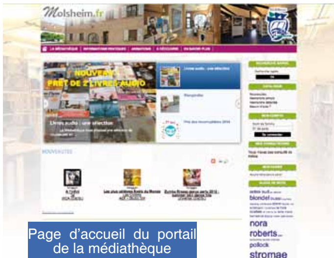
Page d'accueil du portail de la médiathèque

outils indispensables (support WiFi intégré ou carte WiFi supplémentaire) mais aucun branchement réseau n'est nécessaire.