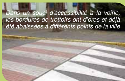
Dans un souci d'accessibilité à la voirie, les bordures de trottoirs ont d'ores et déjà été abaissées à différents points de la ville

le Plan de mise en accessibilité de la voirie et des aménagements des espaces publics (Pave) n'a pas encore été adopté.