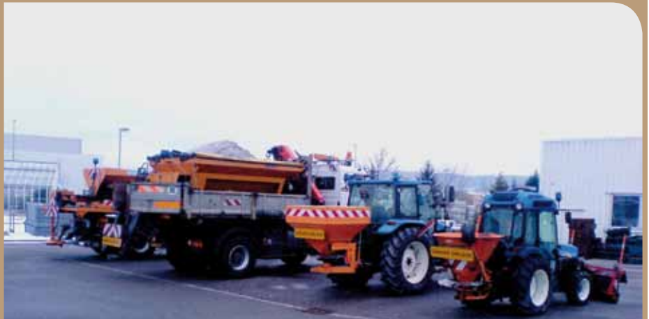
Les services techniques de la Ville sont équipés d'une flotte de véhicules lourds et légers. Ils se chargent de dégager les voiries, les cours d'écoles ainsi que les accès aux bâtiments communaux et lieux publics.

Quelques rappels de base peuvent s'avérer utiles. Durant les temps de neige ou de verglas, les propriétaires, commerçants ou locataires sont