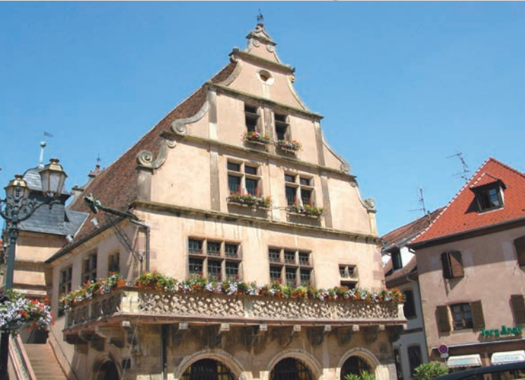
Vues sur la façade Renaissance Sicht auf die Renaissance Fassade Views of the Renaissance facade