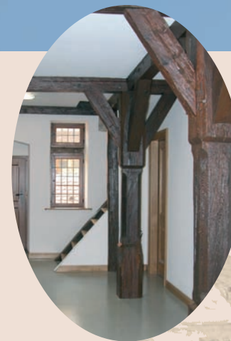
Salle à colonnades au 1 er étage Saal mit Säulen im ersten Stockwerk Room with colonnades in the first floor