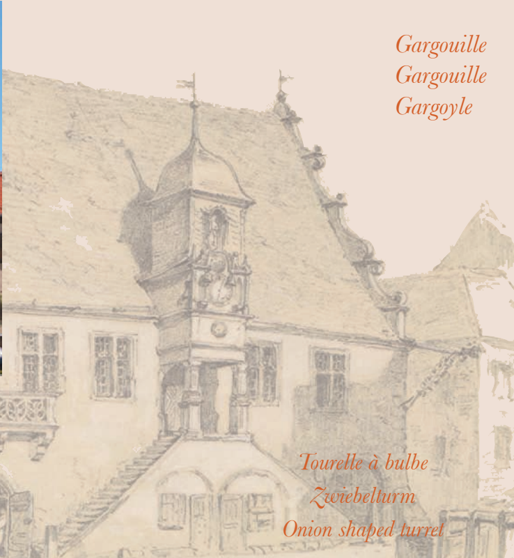
Tourelle à bulbe Zwiebelturm Onion shaped turret